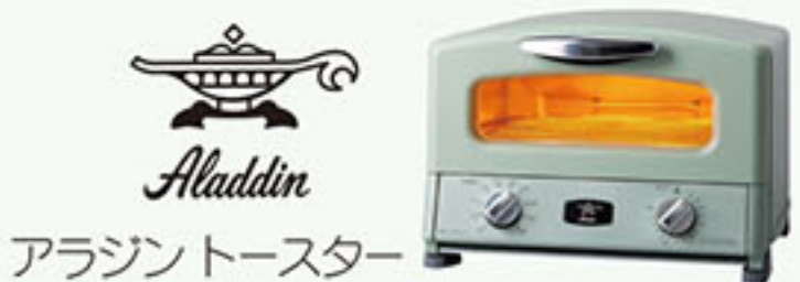
アラジントースター