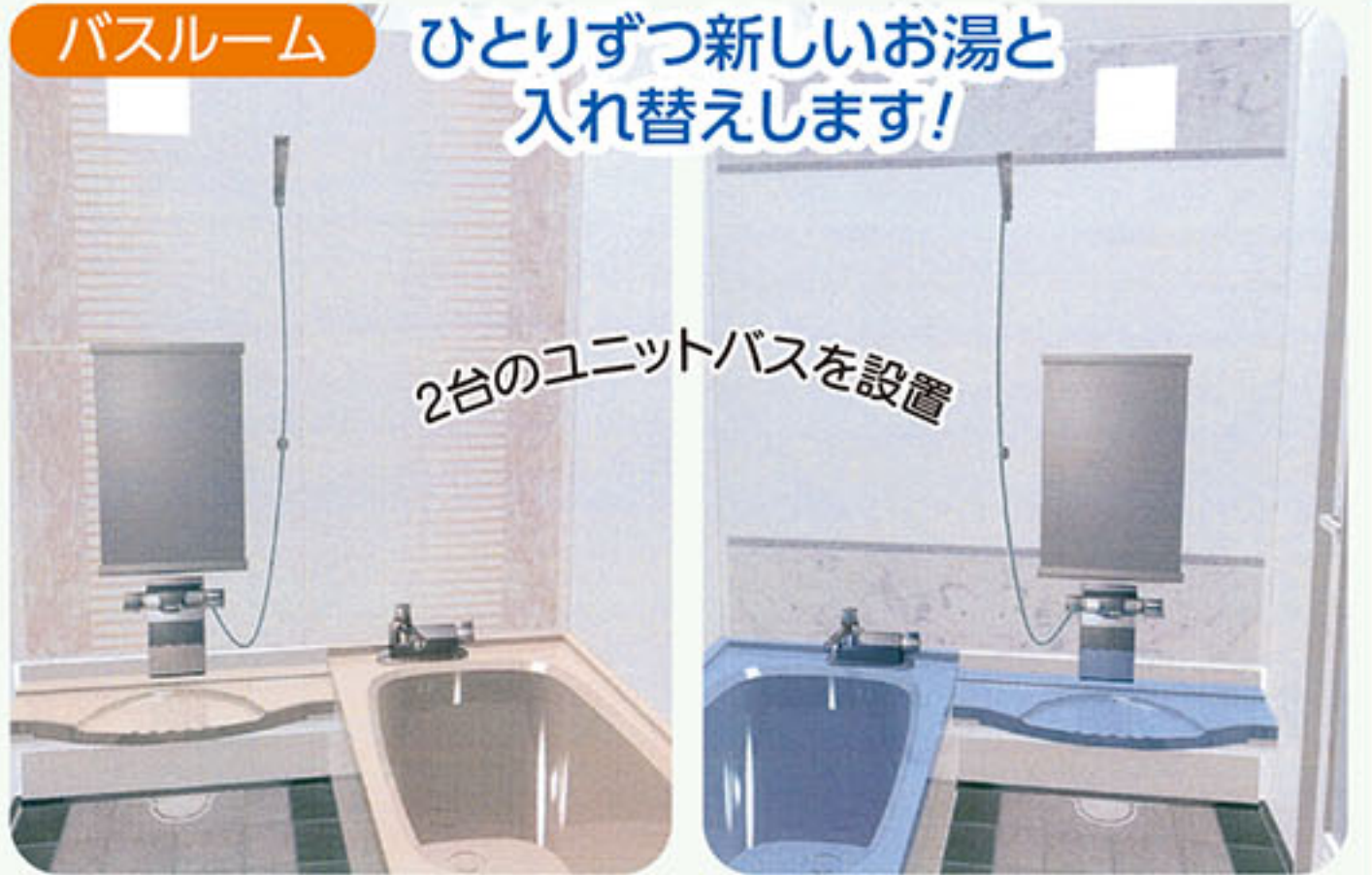
バスルーム ひとりずつ新しいお湯と入れ替えます!